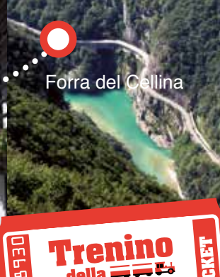
Forra del Cellina