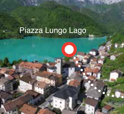
Piazza Lungo Lago